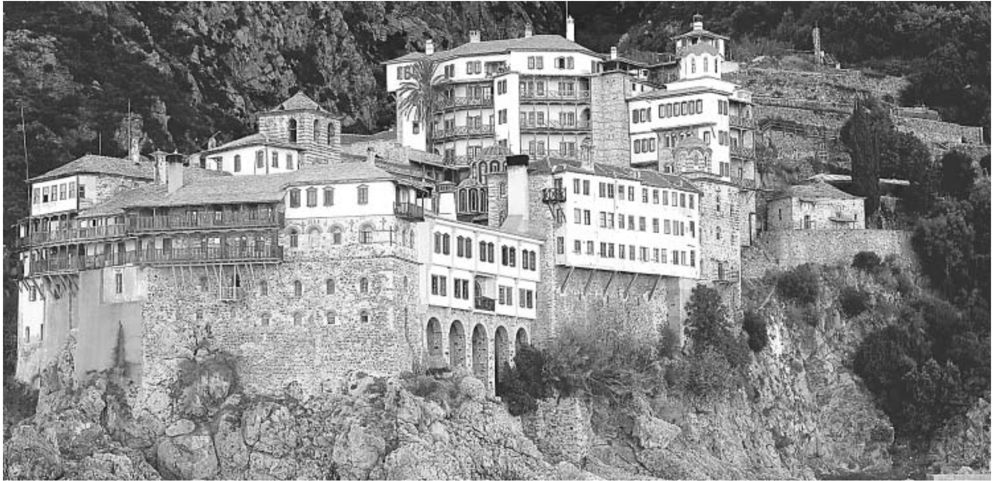
Ιερά Μονή του Οσίου Γρηγορίου