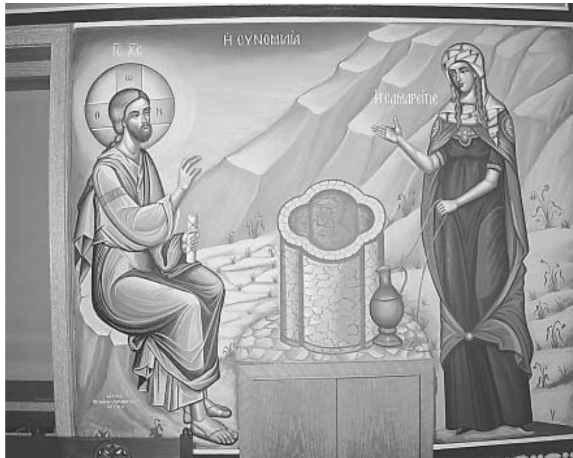
Τοιχογραφία με τον Ιησού Χριστό συνομιλών με την Σαμαρείτιδα

Και σ' αυτό ακριβώς το σημείο ο Χριστός δοκίμασε την ειλικρίνεια και την εντιμότητά της όταν της είπε πάγαινε να φωνάξεις τον άνδρα σου, κι εκείνη του απάντησε δεν έχω άνδρα. Κι ο Χριστός της αποκάλυψε πέντε άνδρες είχες, κι αυτόν που έχεις τώρα δεν είναι άνδρας σου, δηλαδή ήταν παράνομη η σχέση και ο δεσμός της μαζί του. Εκεί-