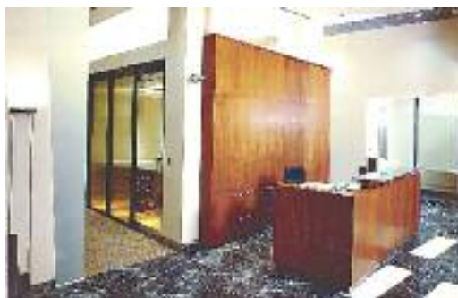
DIALOGBANK, DUCAT PRIVATE BANK - MOSCOW, RUSSIA

JF Contracting Cofp. of Brooklyn, New York have been selected as the General Contractors.