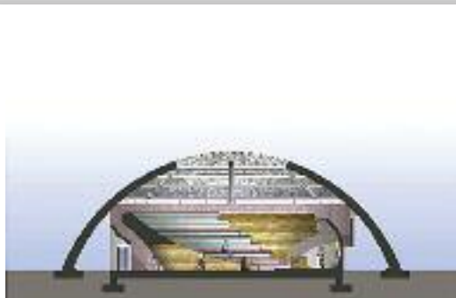
BYZANTINE CHAPEL - USA