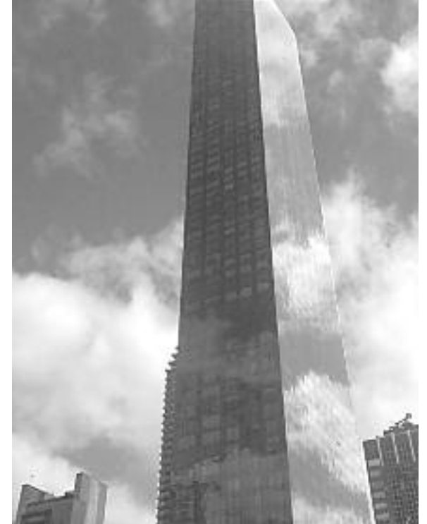
MANHATTAN CONDO, $5,900,000

Σαλόνι με μπαλκόνι και θέα στο "Long Island Sound", τραπεζαρία, επί παραγγελία κουζίνα, 4 υπνοδωμάτια, 3 μπάνια, καθιστικό, 2 τζάκια, γκαράζ για 2 αυτοκίνητα. Προβλήτα για το σκάφος σας.