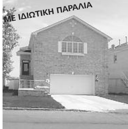
WHITESTONE, ΠΩΛΕΙΤΑΙ $1,888,000 Ή ΕΝΟΙΚΙΑΖΕΤΑΙ $7,000 ΤΟ ΜΗΝΑ WATERFRONT, HI-RANCH

Σαλόνι με μπαλκόνι και θέα στο "Long Island Sound", τραπεζαρία, επί παραγγελία κουζίνα, 4 υπνοδωμάτια, 3 μπάνια, καθιστικό, 2 τζάκια, γκαράζ για 2 αυτοκίνητα. Προβλήτα για το σκάφος σας.