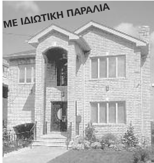
BEECHURST, WATERFRONT-CUSTOME BUILT CENTER HALL COLONIAL $3.5

Μεγάλο καθιστικό με τζάκι, DR, ειδικά κατασκευασμένη μεγάλη κουζίνα (ΕΙΚ), δωμάτιο ψυχαγωγίας, τέσσερα μεγάλα BR, 4 μπάνια, τελειωμένο υπόγειο, γκαράζ για δύο αυτοκίνητα και σκάφος, σε οικόπεδο 20.000 τ.π. Πάνω στο κύμα.