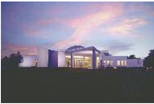
ANNUNCIATION CULTURAL CENTER