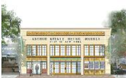
ARTHUR AVENUE RETAIL MARKET - BRONX, NY

In explaining the concept of the 33,000 square foot Cultural Center, Architect Steven Papadatos described the design intent. "The Banquet Hall/Gymnasium", he said, "occupies the center of the Building, which from this simple but truly effective shape intersects with the Atrium, flooding the space with natural lighting. The dramatic spaces are just perfect for these functions." To offset the strong circular aura of Wright's designed Church, Papadatos utilized rectilinear forms to define the exterior envelope facing the Church. However, on the opposite side, the Architect used concentric circles radiating outwards. These same curves echo throughout the interior spaces until intersecting with the high exterior walls bisecting the building, at which point they terminate.