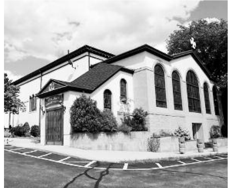
Ο ναός Κοιμήσεως της Θεοτόκου στο Σόμερβιλ Μασαχουσέτης.

Την παραμονή των Χριστουγέννων στις 6 το εσπέρας θα γίνει Εσπερινός και συνακόλουθα η Λειτουργία του