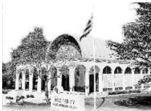
Η εκκλησία της Αγίας Τριάδας στο Μπρίτζπορτ του Κονέκτικατ.

Καλά Χριστούγεννα και Αίσιον το Νέο Έτος 2015