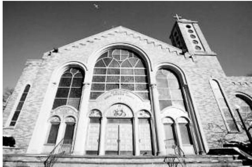
Η εκκλησία Αγίου Δημητρίου Τζαμέικα.

«Ευχόμαστε η χάρις του Γεννηθέντος Ιησού Χριστού να χαρίζει σε όλους υγεία, δύναμη και χαρά. Καλά Χριστούγεννα και Ευλογημένο το Νέο Έτος 2016!