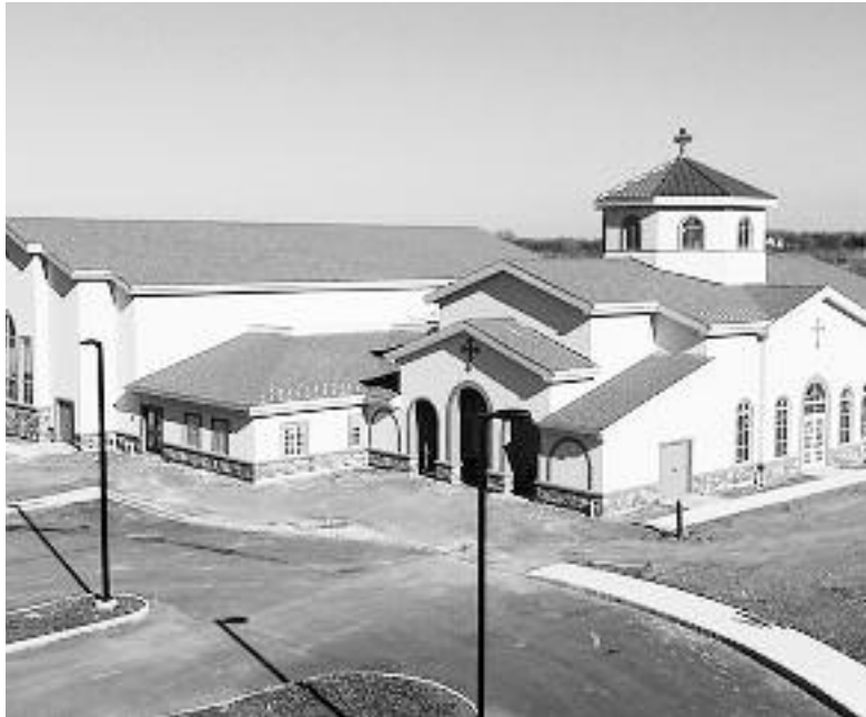
Η εκκλησία της Αγίας Άννας στην περιοχή Φλέμινγκτον του Ν. Τζέρσεϊ.