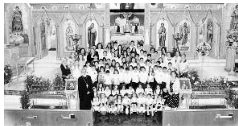
Ο π. Ανάργυρος με μέλη και παιδιά της κοινότητας στην εκκλησία.

Όπως μας ενημέρωσε ο πάτερ Δημήτριος την Κυριακή 13 Δεκεμβρίου αμέσως μετά τη Θεία Λειτουργία πραγματοποιήθηκε η Χριστουγεννιάτικη γιορτή της κοινότητας με τη συμμετοχή του ελληνικού σχολείου και του κατηχητικού.