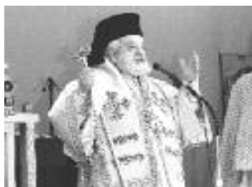
Θα χοροστατήσει ο Σεβασμιότατος Μητροπολίτης Μελός κ. Φιλόθεος

Παρασκευή 25 Η ΚΑΤΑ ΣΑΡΚΑ ΓΕΝΝΗΣΙΣ ΤΟΥ ΚΥΡΙΟΥ ΚΑΙ ΘΕΟΥ ΚΑΙ ΣΩΤΗΡΟΣ ΗΜΩΝ ΙΗΣΟΥ ΧΡΙΣΤΟΥ