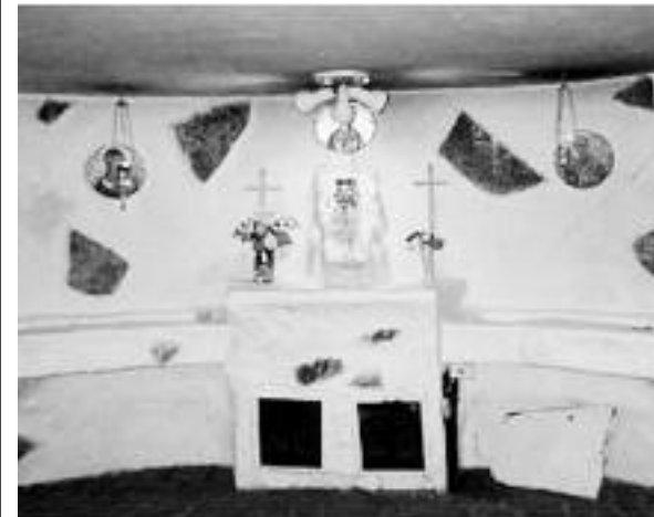
Από το εσωτερικό της Αγίας Παρασκευής.