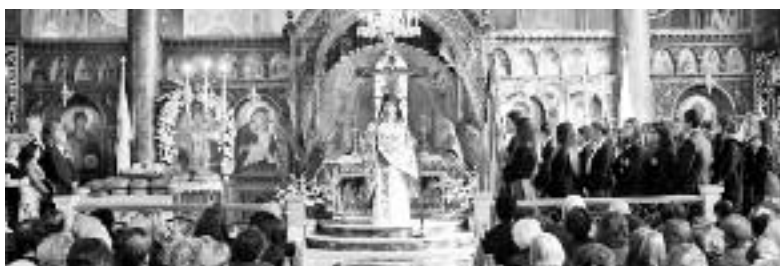
Ο Καθεδρικός Ναός του Αγίου Δημητρίου.

Οι πόρτες της εκκλησίας μας είναι ανοιχτές για προσευχή καθημερινά από τις 7 το πρωί έως τις 3 το απόγευμα και τα γραφεία μας είναι ανοικτά από τη Δευτέρα μέχρι το Σάββατο από τις 9 το πρωί έως τις 5 το απόγευμα» καταλήγει η ανακοίνωση.