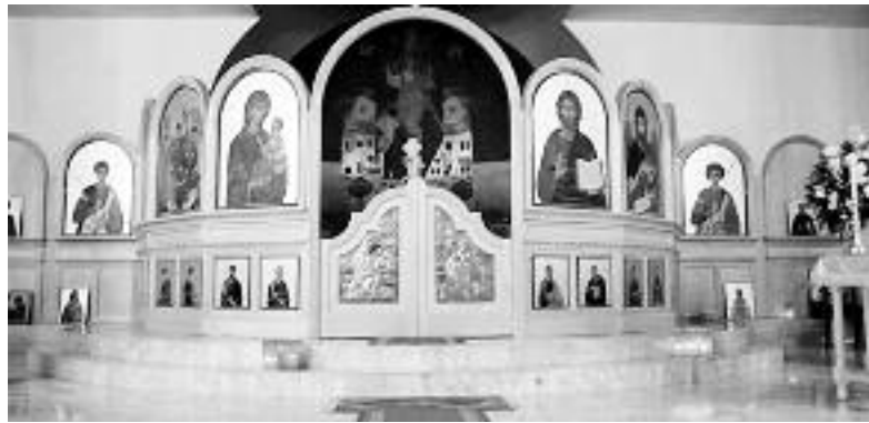
Η εκκλησία της Αγίας Τριάδας/Αγίου Νικολάου.