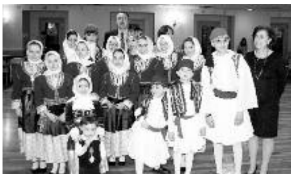
Το χορευτικό συγκρότημα της κοινότητας Κοιμήσεως της Θεοτόκου στο Πωτάκετ του Ροντ Αϊλαντ.