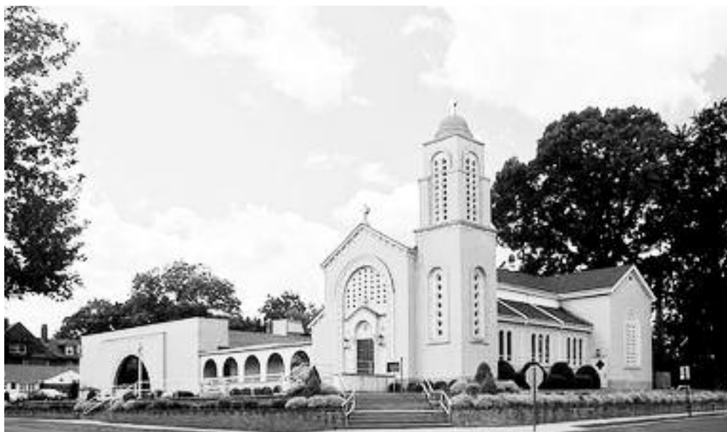
Η εκκλησία του Αγίου Γεωργίου στο Κονέκτικατ που συμπλήρωσε 100 χρόνια λειτουργίας.