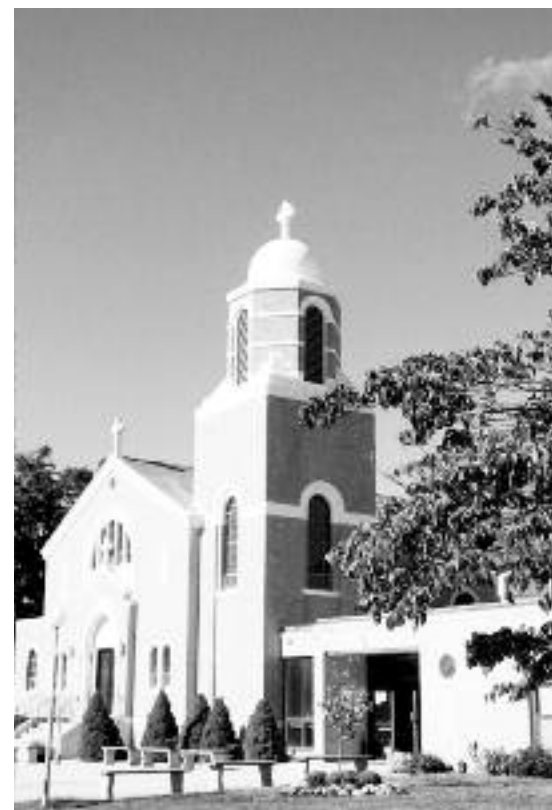
Η εκκλησία της Αγίας Σοφίας στην περιοχή Νιου Λόντον του Κονέκτικατ.

«Για να τιμήσουμε τα Χριστούγεννα η εκκλησία μας θα τελήσει πολλές λειτουργίες για τους πιστούς για να δοξάσει το Μέγα Μυστήριο της Γέννησης του Σωτήρος Χριστού» δώλωσε ο π. Πανάγος.