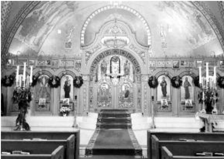
Το εσωτερικό του ναού της Μεταμορφώσεως του Σωτήρος στο Λόουελ της Μασαχουσέτης.