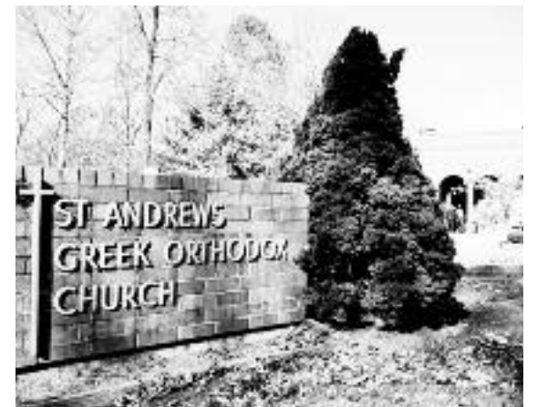
Η εκκλησία του Αγίου Ανδρέα.

Χριστούγεννα και ευτυχισμένο το 2016. Ο π. Ιωάννης Θεοδοσίου μαζί με την Εκκλησιαστική Επιτροπή και ολόκληρη την κοινότητα εύχονται σε όλους ευλογημένη Θεία Γέννηση και η νέα χρονιά να είναι γεμάτη από υγεία, ευτυχία και πάνω από όλα σωτηρία της ψυχής».