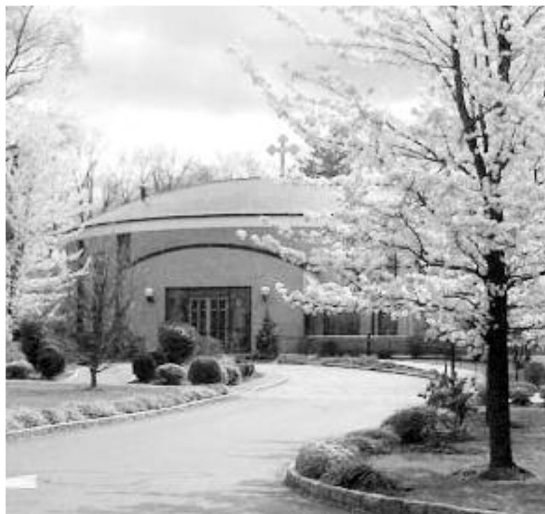
Η εκκλησία της Αγίας Τριάδας στην περιοχή New Rochelle της Ν. Υόρκης.

όλους τους Ορθόδοξους Χριστιανούς στην εκκλησία μας για να δοξάσουμε το Θεό», τόνισε ο π. Νικόλαος.